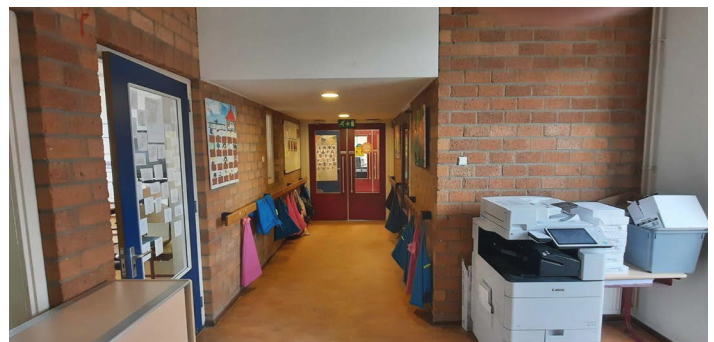
hoe de gangen er voor de renovatie uitzagen