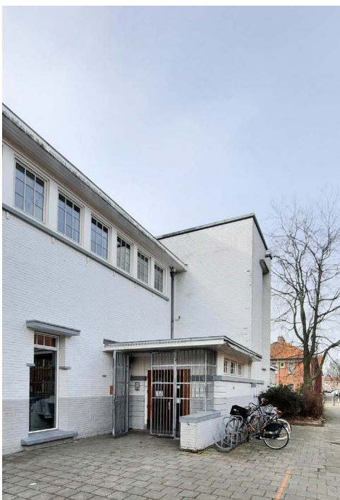
Gevels voor de renovatie

Zoals op de foto hiernaast goed te zien is waren ook de kozijnen die bij een eerdere opknopbeurt geplaatst waren in dermate slechte staat dat we deze allemaal vervangen hebben met de Reynaers Slimline 38 classic + Masterline 8 Deco. De keuze voor specifiek deze profielen komt voort uit de rankheid en uitstraling die zij hebben en omdat we hiermee het dichtste bij de oude houten kozijnen konden komen ‘zelfs bij de bijzondere erker ramen’ . Het resultaat zijn wij trots op omdat de school zijn authentieke uitstraling zoals bedoeld in 1930 weer terug heeft maar dan wel op een hedendaags bouwkundig niveau.