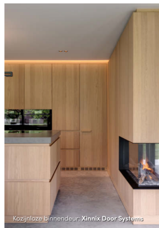
Kozijnloze binnendeur: Xinnix Door Systems