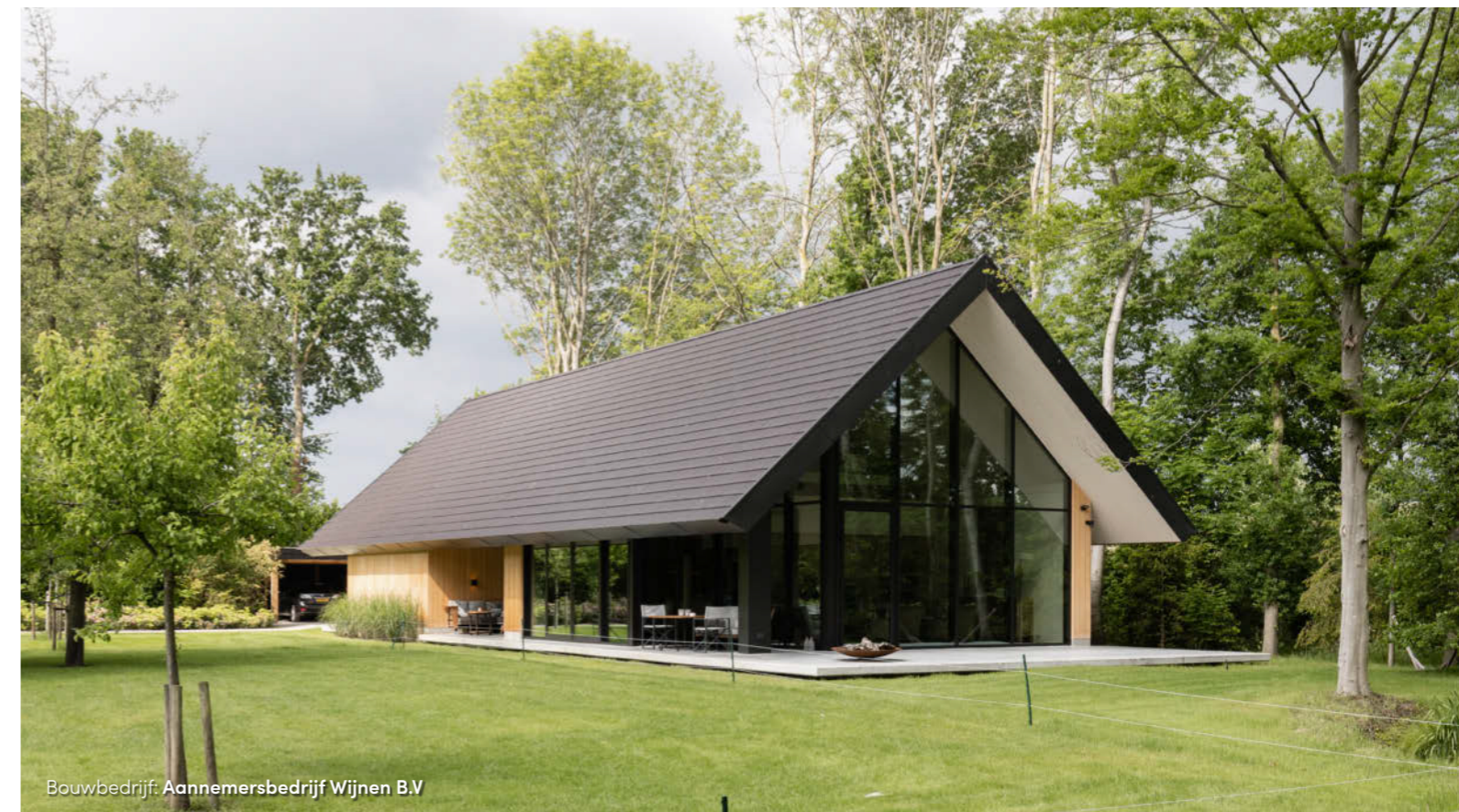
Bouwbedrijf: Aannemersbedrijf Wijnen B.V

veel materialen met elkaar te combineren. In dit project hebben we gekozen voor hout, beton en wit stucwerk als hoofdtonen. Zwart komt niet in de natuur voor, daarom kozen we voor een donkere kleur die het zwart benadert, maar heel warm oogt als het licht erop schijnt. De dakpannen zijn in dezelfde warme tint. Zo oogt de woning niet hard en past deze in de omgeving." De