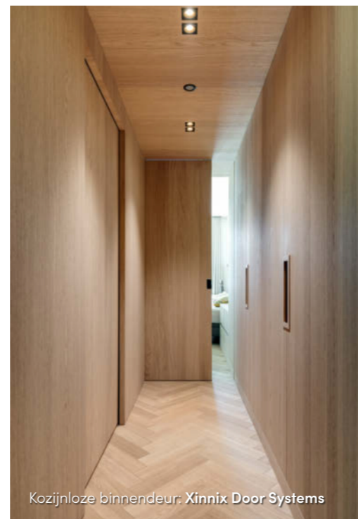
Kozijnloze binnendeur: Xinnix Door Systems