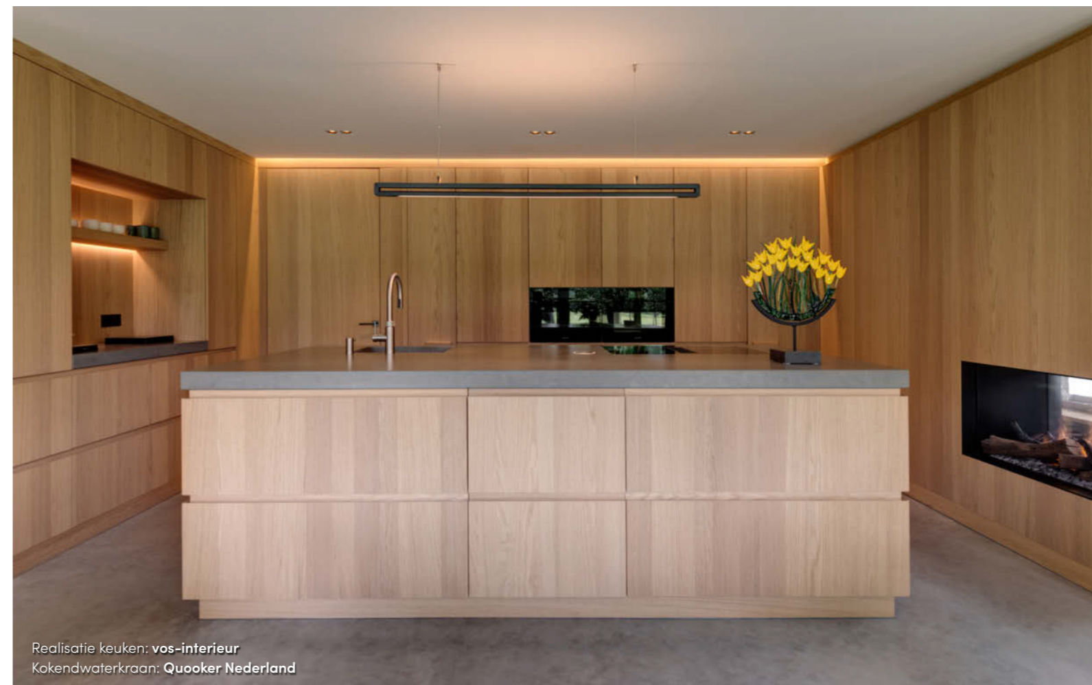
Realisatie keuken: vos-interieur Kokendwaterkraan: Quooker Nederland

tot in de living. En zelfs tot aan buiten. Daardoor zijn delen van de open ruimte in elkaar verweven en ontstaat er een verbinding waar je ook kijkt: van de beneden- tot de bovenverdieping, tot de leefgedeeltes onderling. De