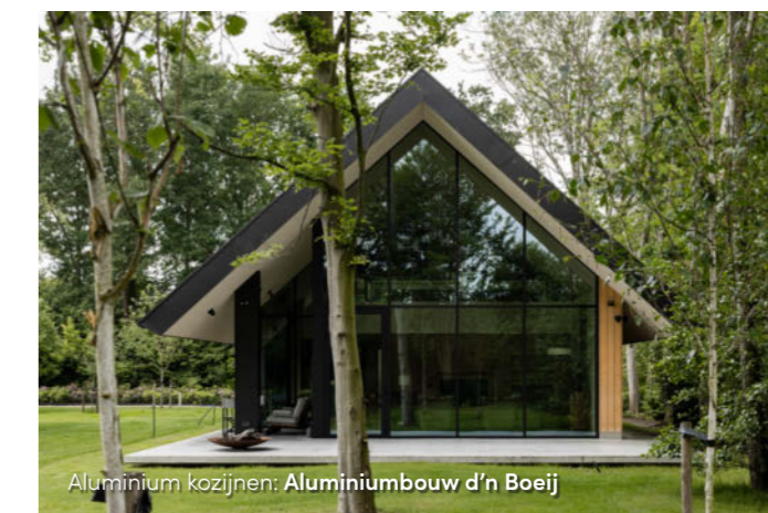
Aluminium kozijnen: Aluminiumbouw d'n Boeij