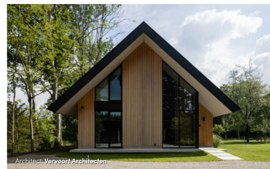
Architect: Vervoort Architecten

vlakken van het dak zijn bewust dun gehouden, met zo min mogelijk details. Er zijn geen dakopeningen, geen dakkapellen. Op enkele plaatsen sluit het dak aan op het gevelvlak en raakt het het maaiveld. Daarmee maakt het onderscheid tussen enerzijds de entreezone en anderzijds de leefruimtes. Het resultaat is een bescheiden villa met een heldere vormtaal en een eerlijk karakter.